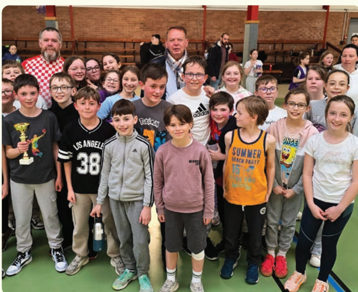
L'école Marie-Curie a organisé un tournoi USEP de basket-ball avec les écoles du Quesnoy, de Louvignies et Houdain-lez-Bavay soit 161 enfants.