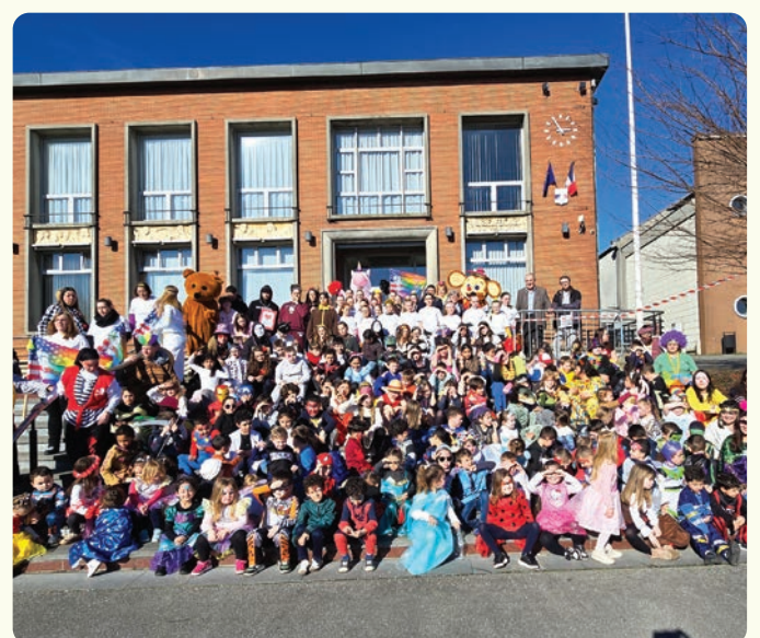
Le 25 février, tous les enfants du centre de loisirs se sont réunis pour un défilé de Carnaval.