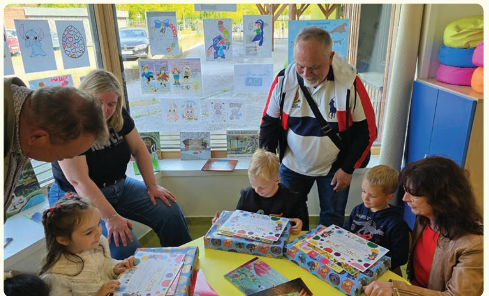
Fin de cycle pour le club des petits parleurs : l'opération Coup de pouce CLA s'est terminée pour les maternelles de Triolet et Tortel.