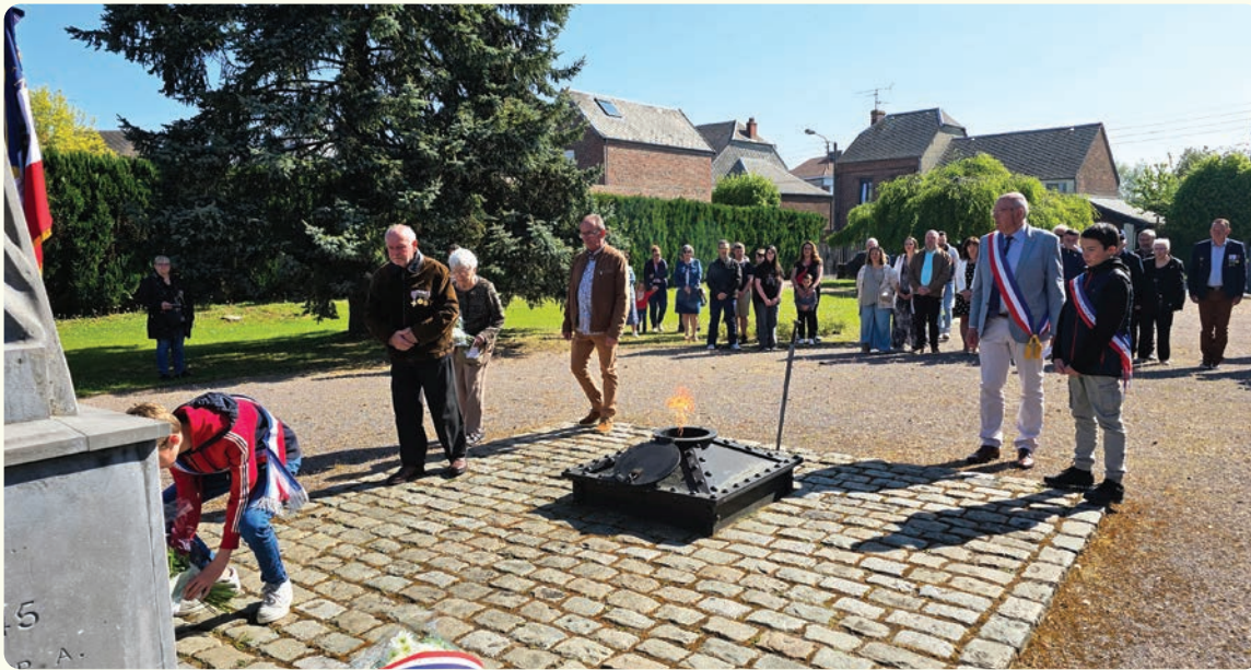
Le dimanche 26 avril, la Ville a organisé la commémoration de la journée nationale d'hommage aux héros et victimes de la Déportation.