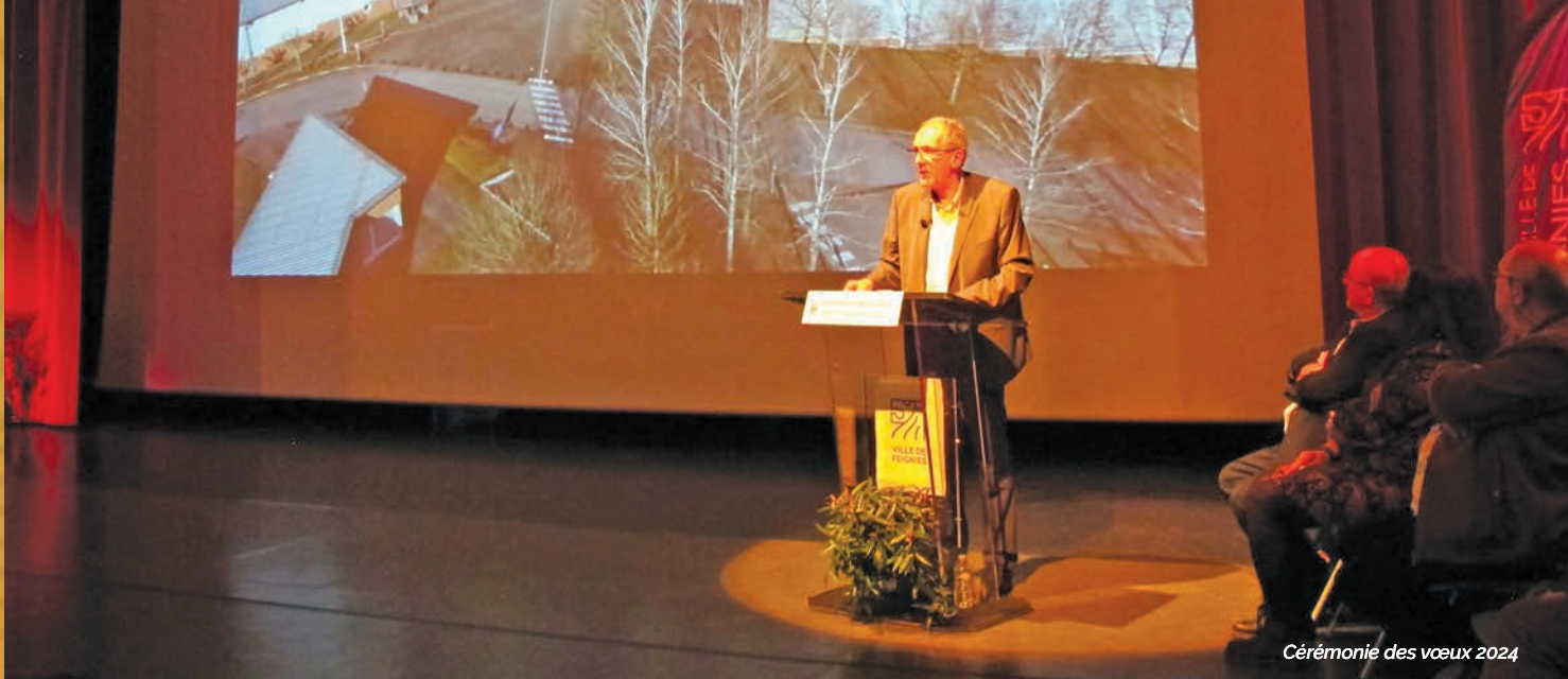
Cérémonie des vœux 2024