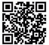
Vidéo Rétrospective 2023