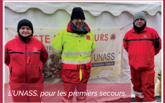
L'UNASS, pour les premiers secours.