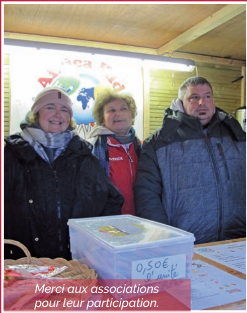
Merci aux associations pour leur participation.