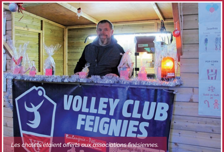
Les chalets étaient offerts aux associations finésiennes.