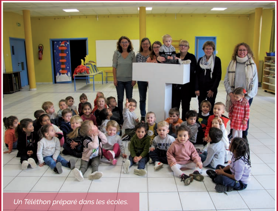
Un Téléthon préparé dans les écoles.