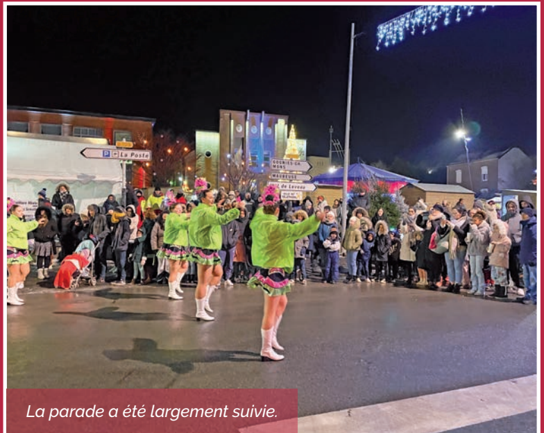
La parade a été largement suivie.