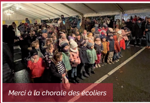
Merci à la chorale des écoliers