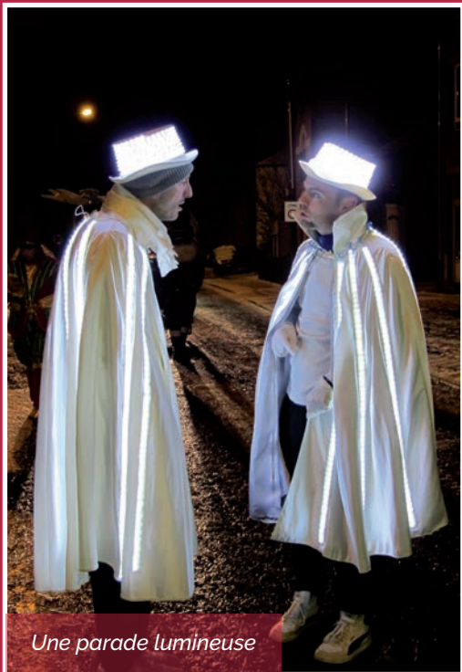
Une parade lumineuse