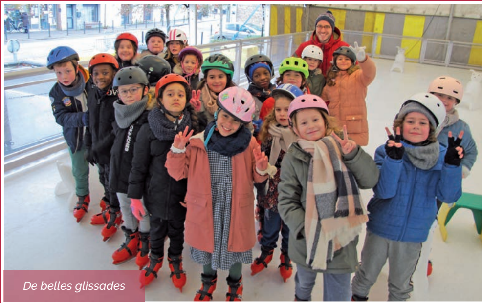
De belles glissades