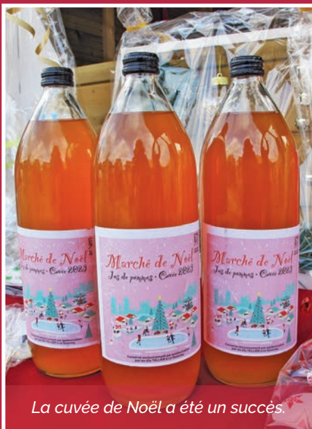
La cuvée de Noël a été un succès.