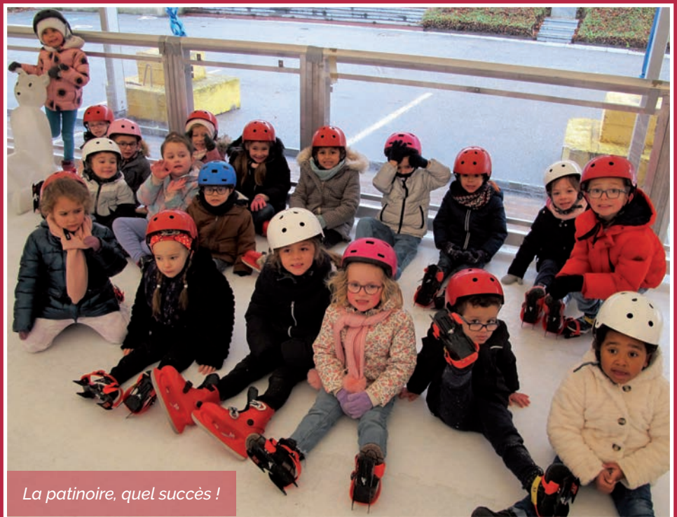
La patinoire, quel succès !