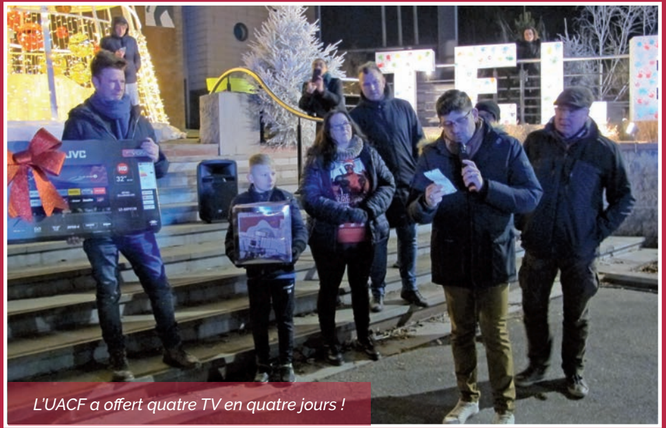
L'UACF a offert quatre TV en quatre jours !