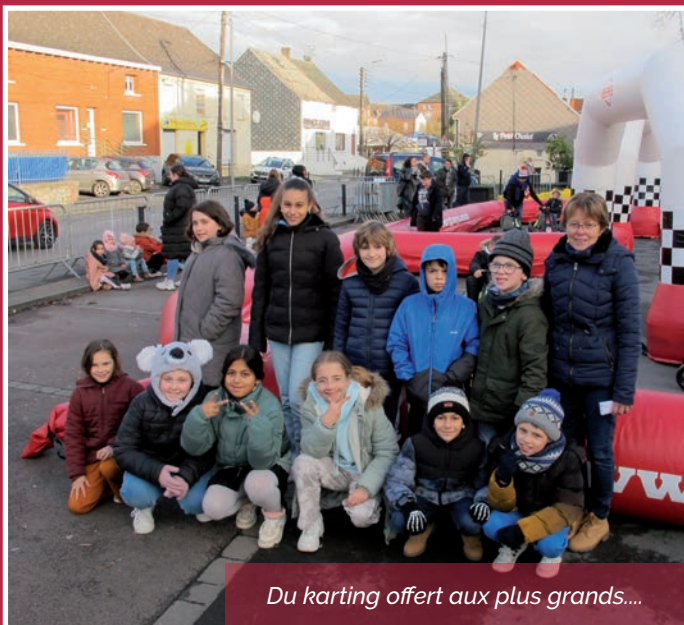
Du karting offert aux plus grands...