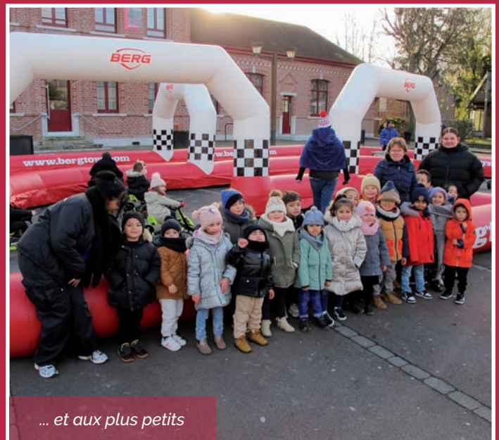
... et aux plus petits