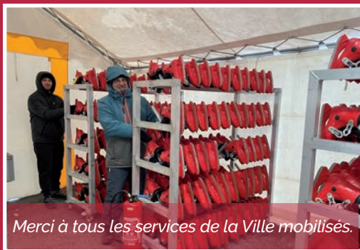
Merci à tous les services de la Ville mobilisés.