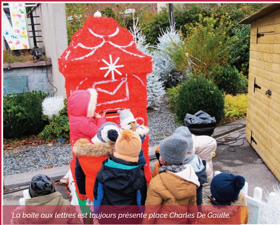
La boîte aux lettres est toujours présente place Charles De Gaulle.