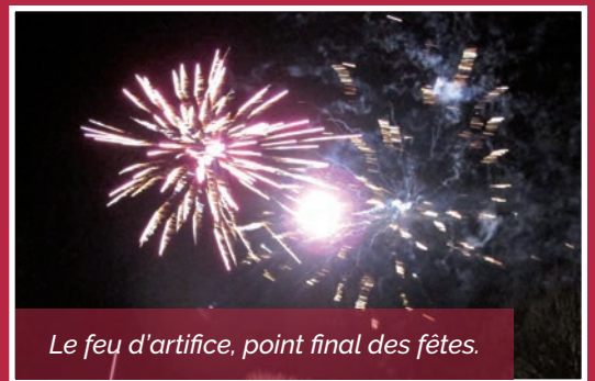
Le feu d'artifice, point final des fêtes.