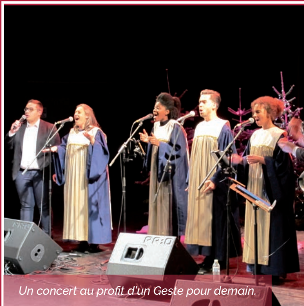
Un concert au profit d'un Geste pour demain.