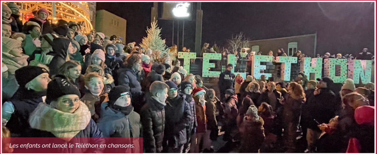
Les enfants ont lancé le Téléthon en chansons.