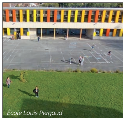
École Louis Pergaud

Il est accessible depuis un portail automatique et fonctionne selon des horaires définis de l'école et des activités de la salle de danse. En-dehors de ces créneaux, il restera fermé.