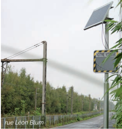
rue Léon Blum

La ville de Feignies vient de se doter de 3 panneaux pédagogiques indicateur de vitesse. Ils viennent en complément de ceux déjà existants. Ils sont installés rue Keyworth, rue