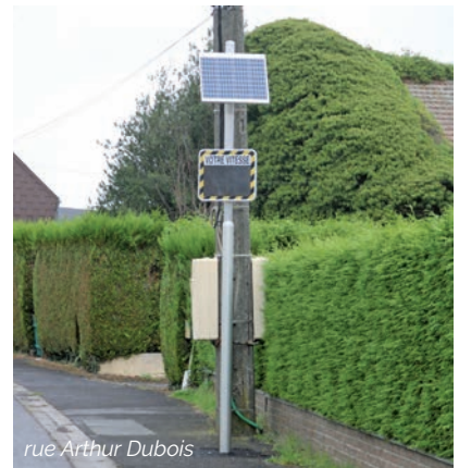
rue Arthur Dubois

Un relevé de ces infractions est communiqué au commissariat de Police de Maubeuge qui peut programmer de manière plus efficace les contrôles routiers.