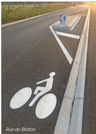
Rue de Blaton

La rue Blaton est un chantier débuté en mars 2023. Un budget de 700 000 €, dont 463 933 € à la charge de la ville. Nouveaux trottoirs, bande cail-