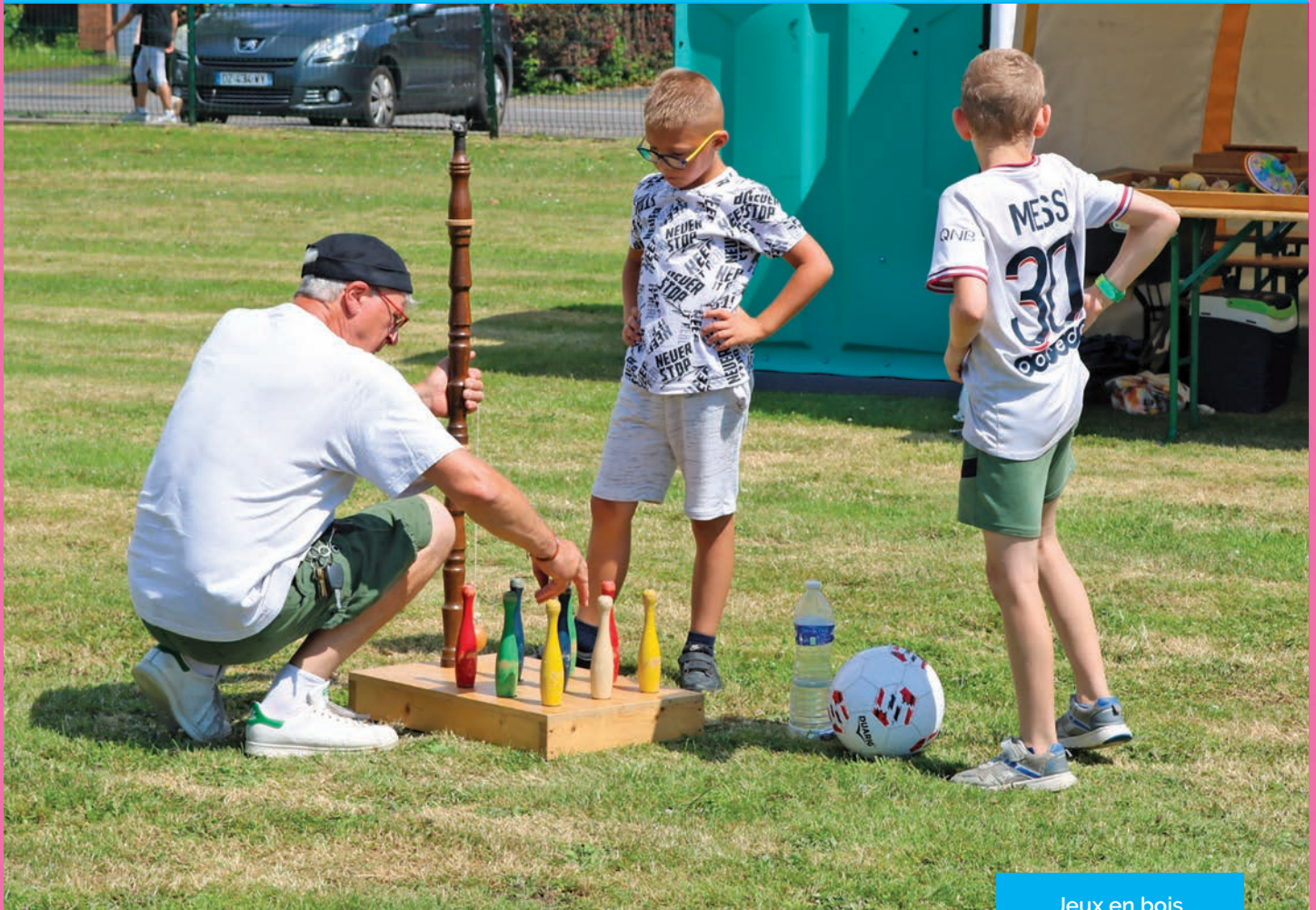
Jeux en bois