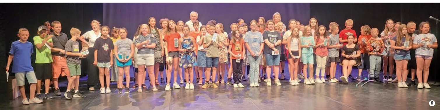
| 1 Commémoration de l'appel du 18 juin du Général De Gaulle | 2 Exposition annuelle de l'atelier d'Arts plastiques | 3 Fête de la musique à la médiathèque Jean Jarosz | 4 Sortie accrobranche au centre de loisirs | 5 Balades insolites et concert au Fort de Leveau | 6 Remise des calculatrices aux élèves de CM2