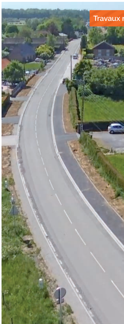
Travaux rue de Blaton

À l'initiative de la ville et dans un souci d'échanges constructifs, une réunion d'information publique avec les riverains a été organisée pour les tenir informés des projets, des travaux ou des événements qui pourraient avoir un impact sur leur quartier ou leur environnement immédiat.