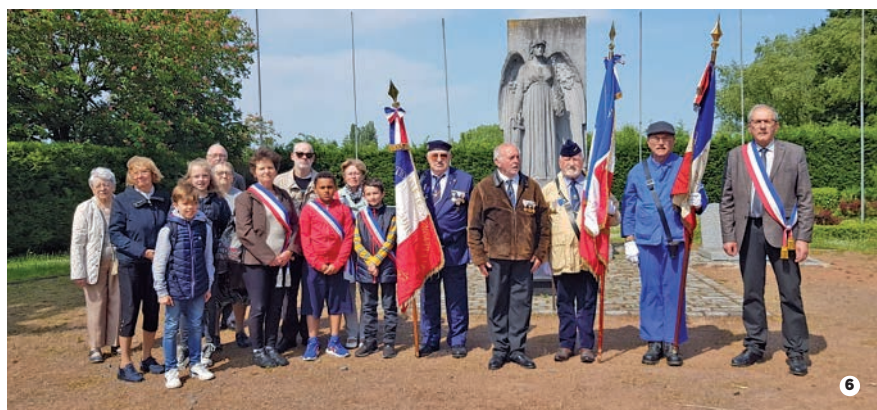
1 Atelier « Pâques et pâquerettes » à la médiathèque Jean Jarosz 2 Centre de loisirs des vacances de printemps 3 Installation d'un réservoir d'eau de 5000 litres financé par l'association Africa Kids grâce aux diverses activités de 2022, installé en novembre 2022 dans la cour de l'école partenaire en Gambie 4 Spectacle scolaire « Attrape-moi » à l'Espace Gérard Philippe 5 L'exposition 4F « Feignies d'autrefois » plébiscitée par près de 150 visiteurs 6 Journée nationale de la Résistance avec l'UNC