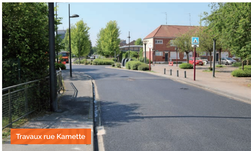
Travaux rue Kamette