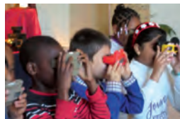
Exposition-spectacle « Vingt mille yeux sous les rêves »

Un moment de découverte à partager en toute convivialité, seul, en famille ou entre amis, pour un accord ciné-soupe des plus savoureux !