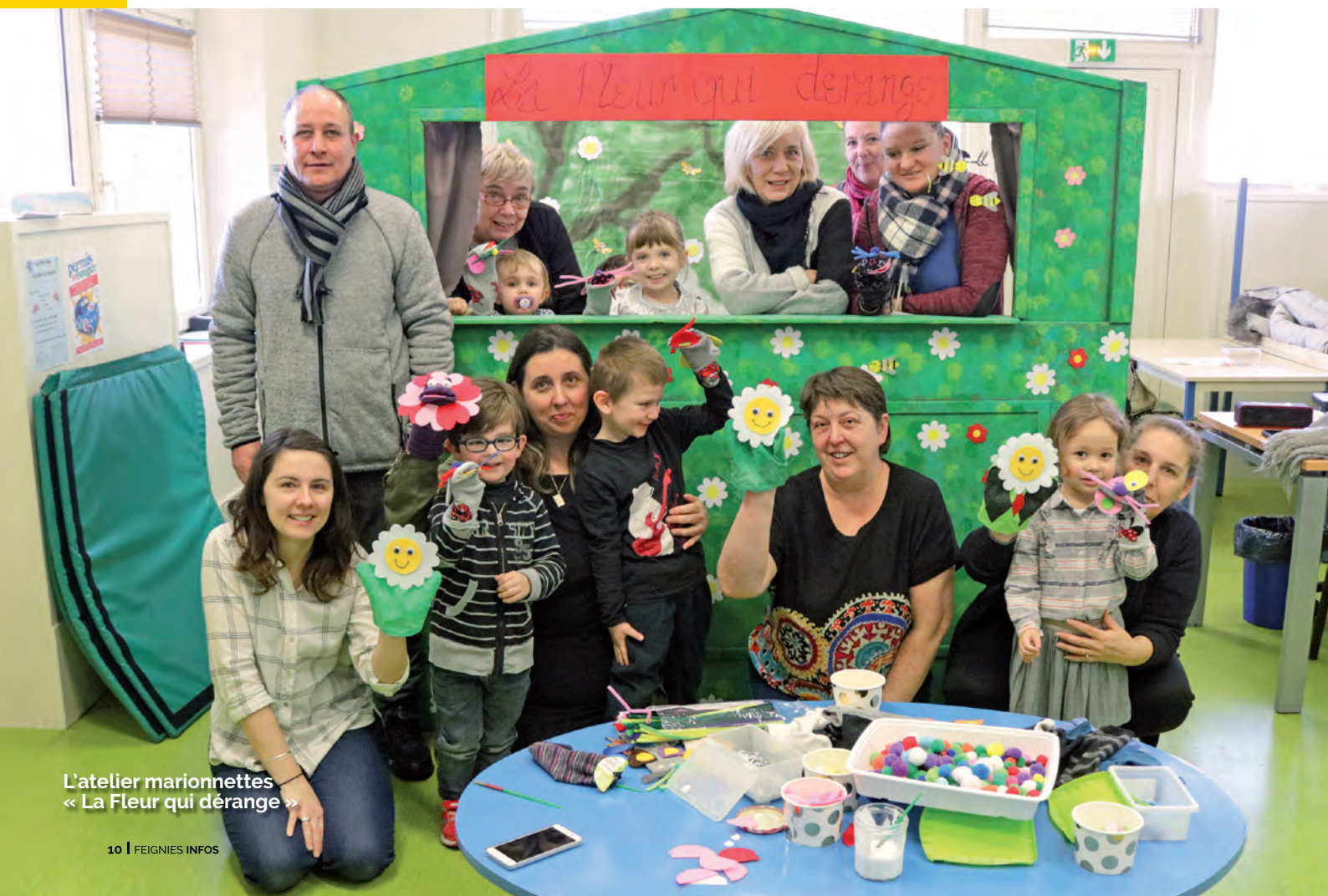
L'atelier marionnettes « La Fleur qui dérange »

Un succès pour les organisatrices du service petite enfance, en collaboration avec les agents du service jeunesse, les agents territoriaux spécialisés des écoles maternelles, animatrices babygym et agents de la médiation.