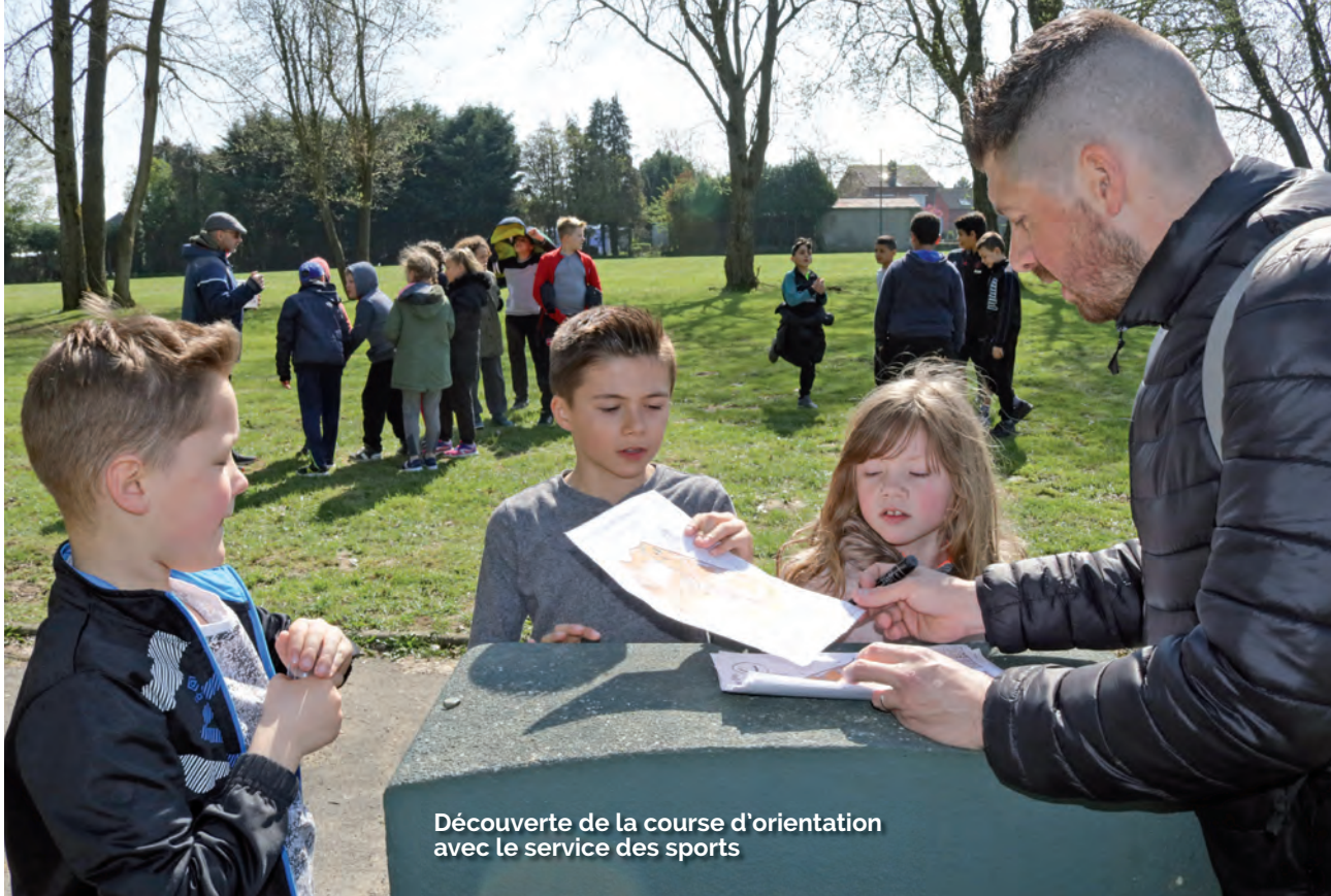
Découverte de la course d'orientation avec le service des sports

Les stages sportifs regroupent une vingtaine d'enfants lors des petites vacances.