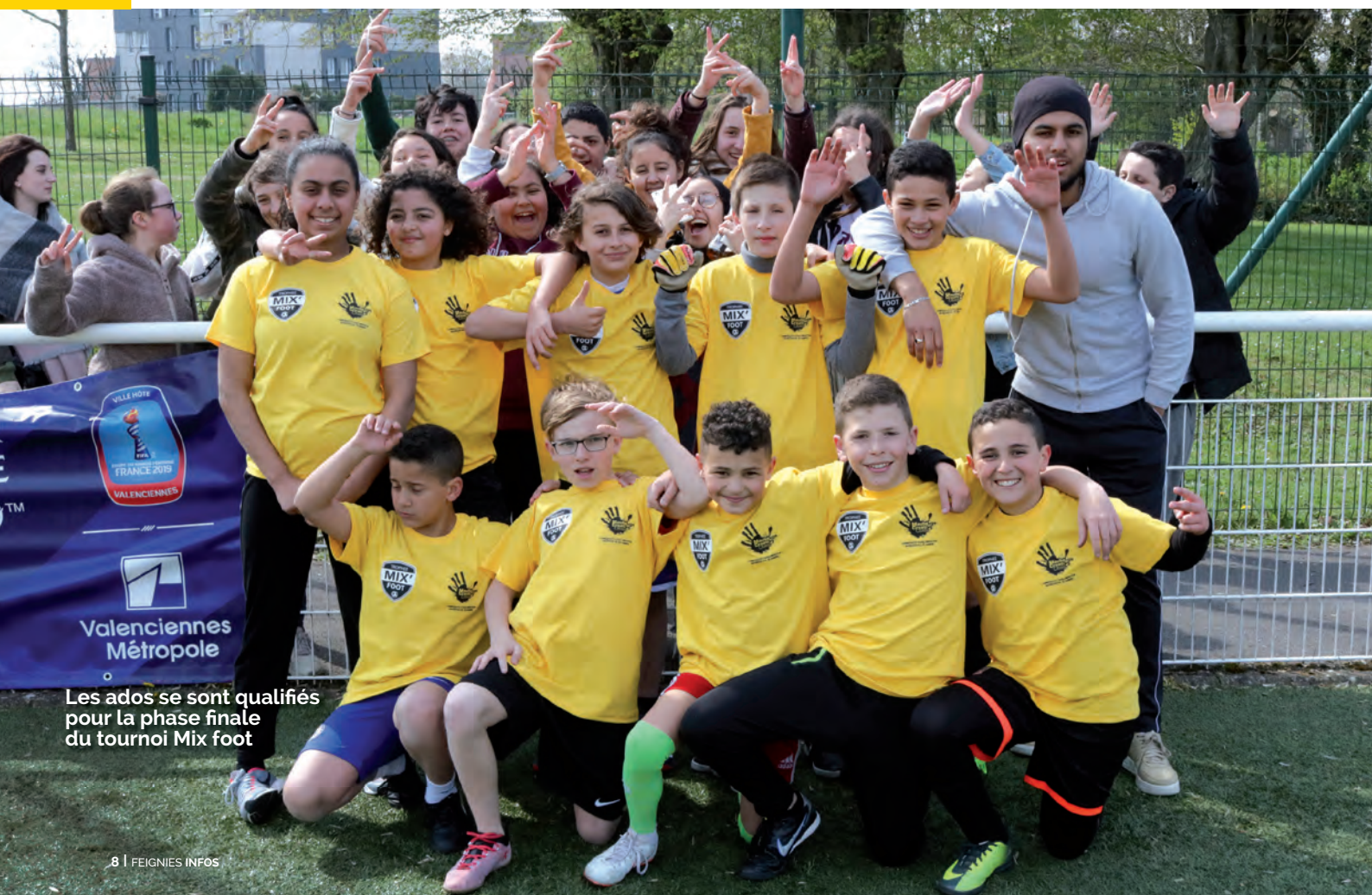
Les ados se sont qualifiés pour la phase finale du tournoi Mix foot

L'été et lors des petites vacances scolaires, la Ville de Feignies accueille en moyenne dans ses centres de loisirs 70 enfants de maternelle, 80 enfants de primaire, ainsi que 40 adolescents.